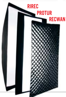
RIREC 60/80, 60 x 100 / 80 x 140 cm PROTUR, für RIREC 60 RECWAN 60/80, 60 x 100 / 80 x 140 cm