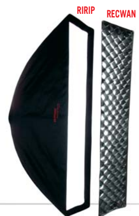
RIRIP 30, 30 x 140 cm RECWAN 30, 30 x 140 cm