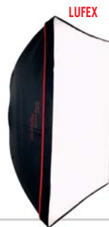
LUFEX 65, 65 x 65 cm